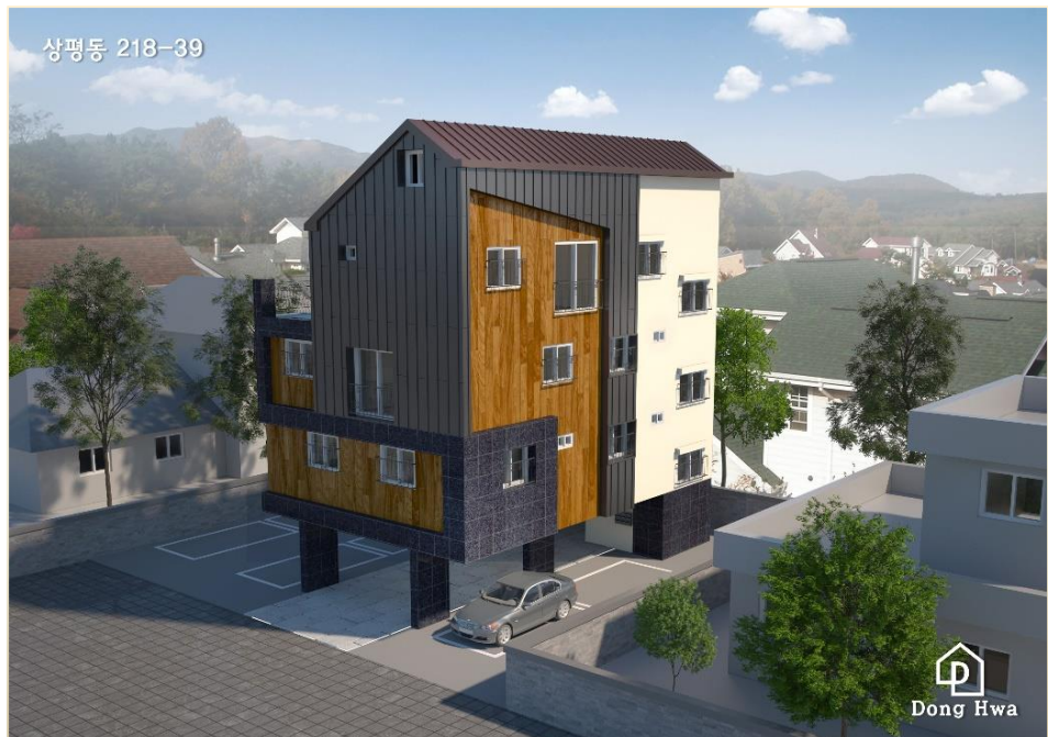
상평동 218-39 다가구주택 신축공사