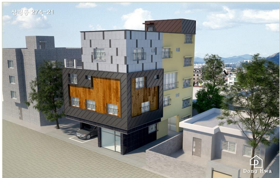
상평동 274-21번지 다가구주택 신축공사