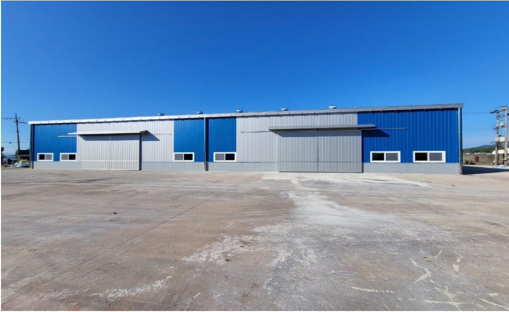
송월테크놀로지(주) 창고 대수선 공사