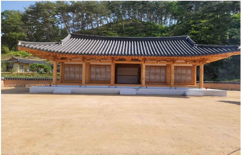
산청 독립운동 관광자원화 사업