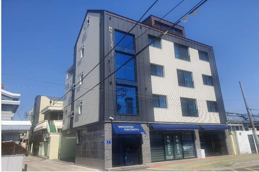
상대동 296-120번지 근생 및 다가구주택 신축공사