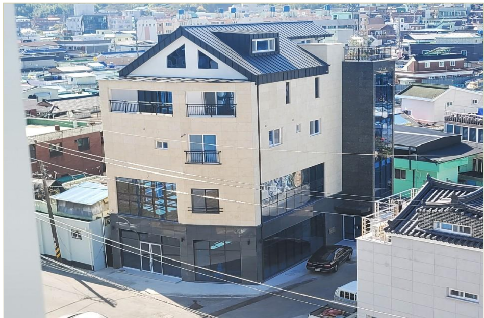
망경동 65-37 근생 및 다가구주택 신축공사