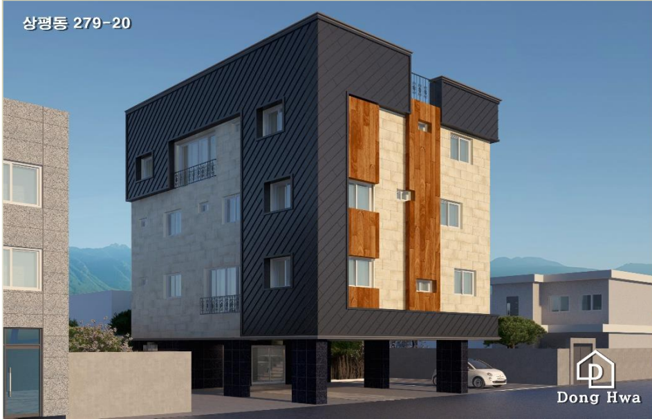
상평동 279-20 다가구주택 신축공사