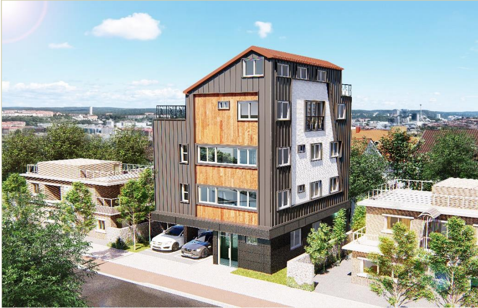
상평동 245-25 다가구주택 신축공사