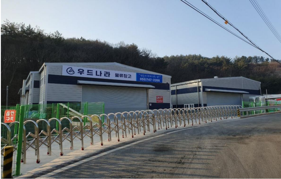
독산리 대진목재 창고 신축공사