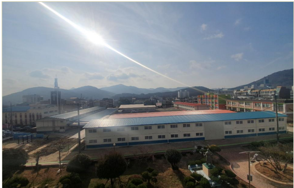
남해초등학교 임시교사 설치공사