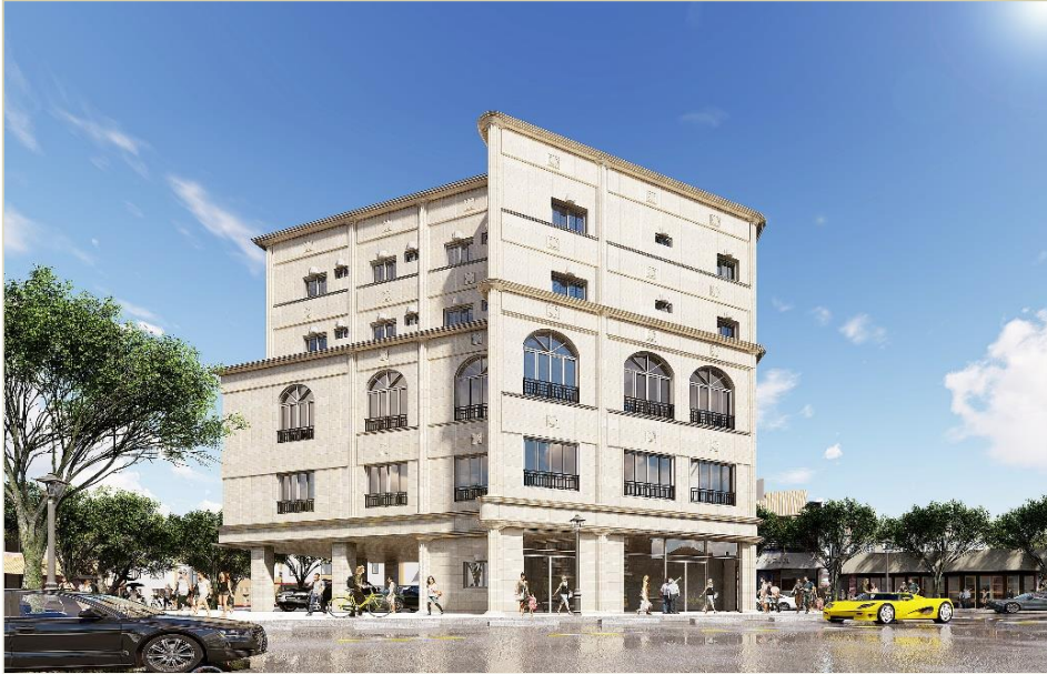
OK CITY 근린생활시설 신축공사