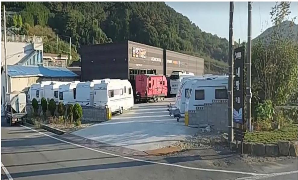
낭만카라반 공장 신축공사