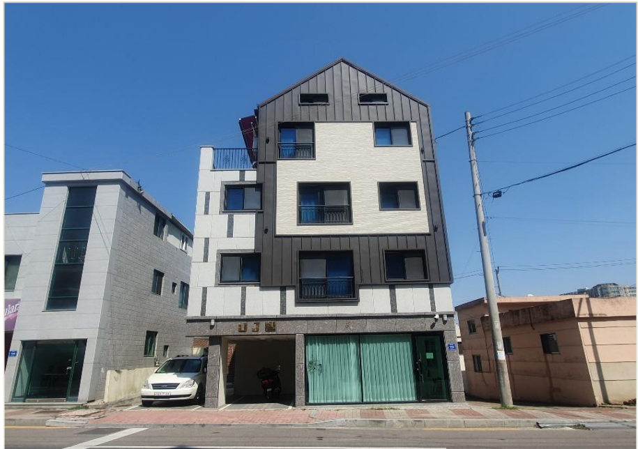
망경동 535-27번지 근생 및 다가구주택 신축공사