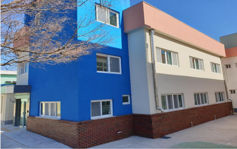
창선고 제2기숙사 증축공사