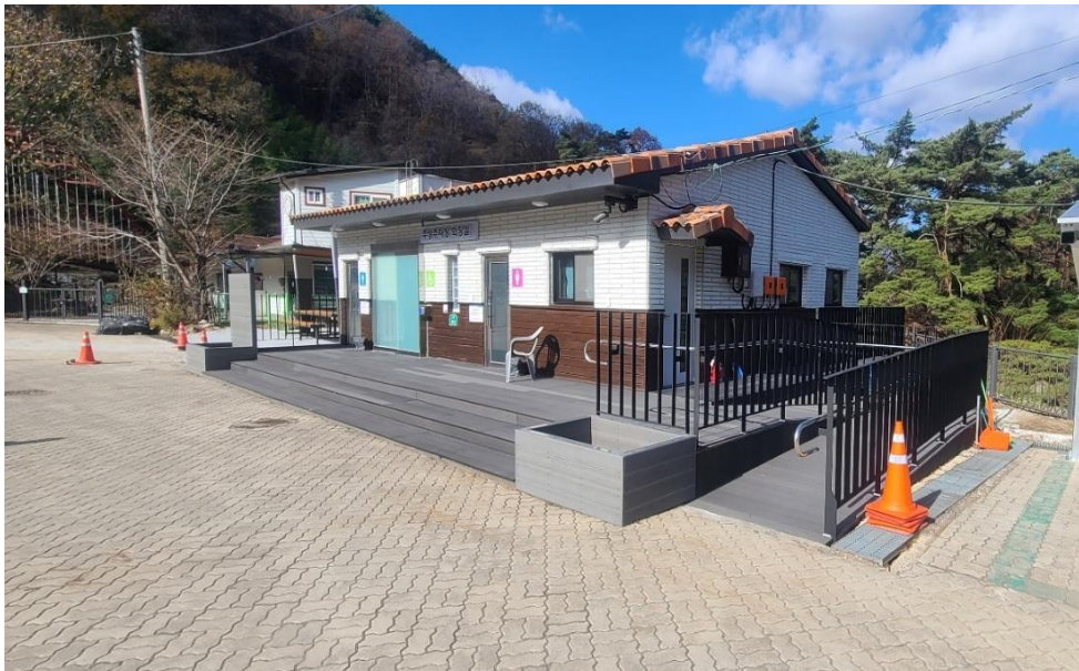
2023지리산경남 공중화장실 에코리모델링 정비공사