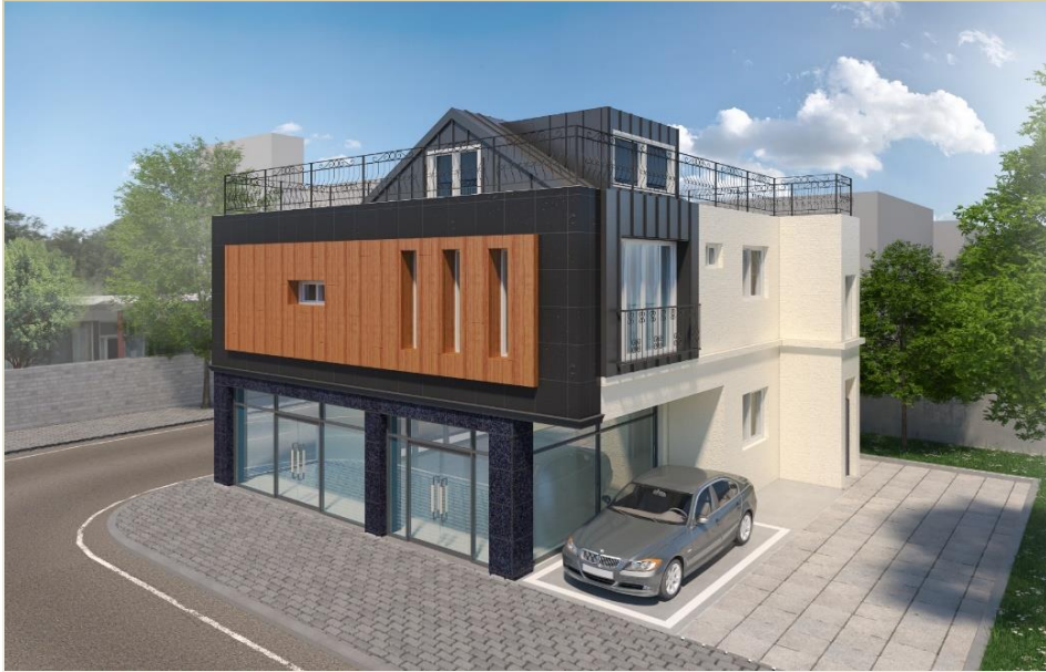
봉래동 236번지 상가주택