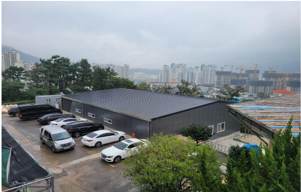
서원곡 씨름연습장동 리모델링 공사