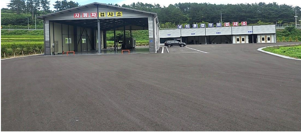
1604 자동차 정비공장 신축공사