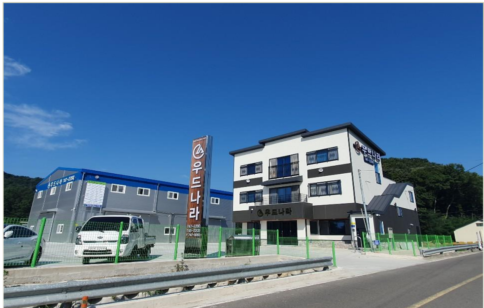
이현동 522-1 근린생활시설 및 주택신축공사