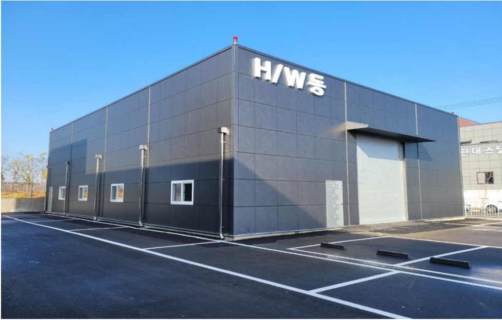
진주시 뿌리산단 테스코(주) 공장 증축공사