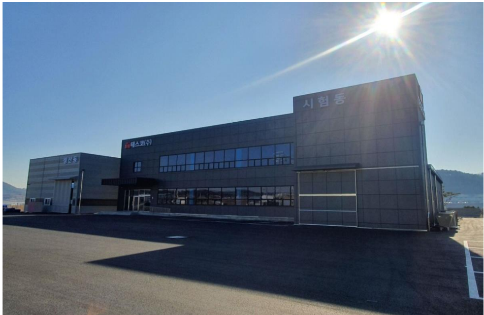
진주 정촌 뿌리산단 테스코(주) 공장