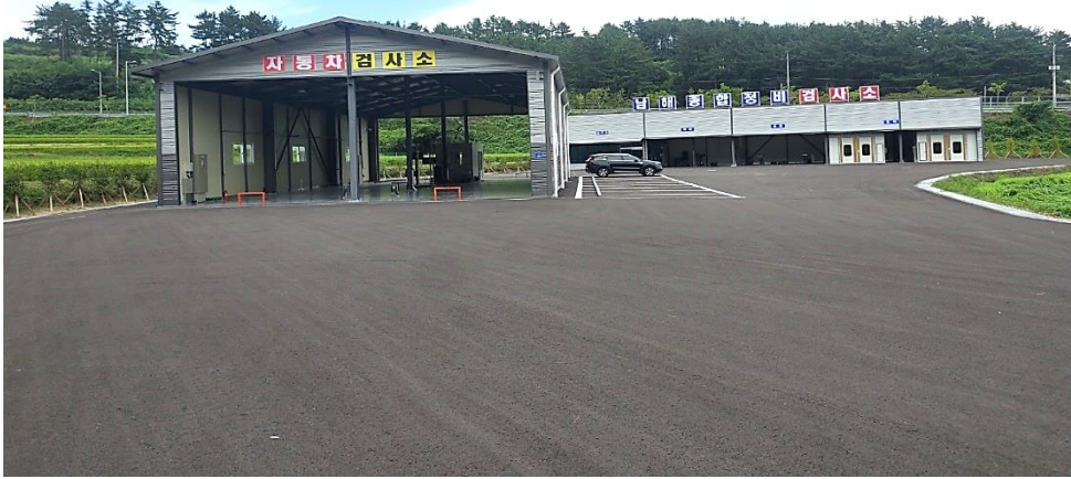
1604 자동차 정비공장 신축공사(진행중)