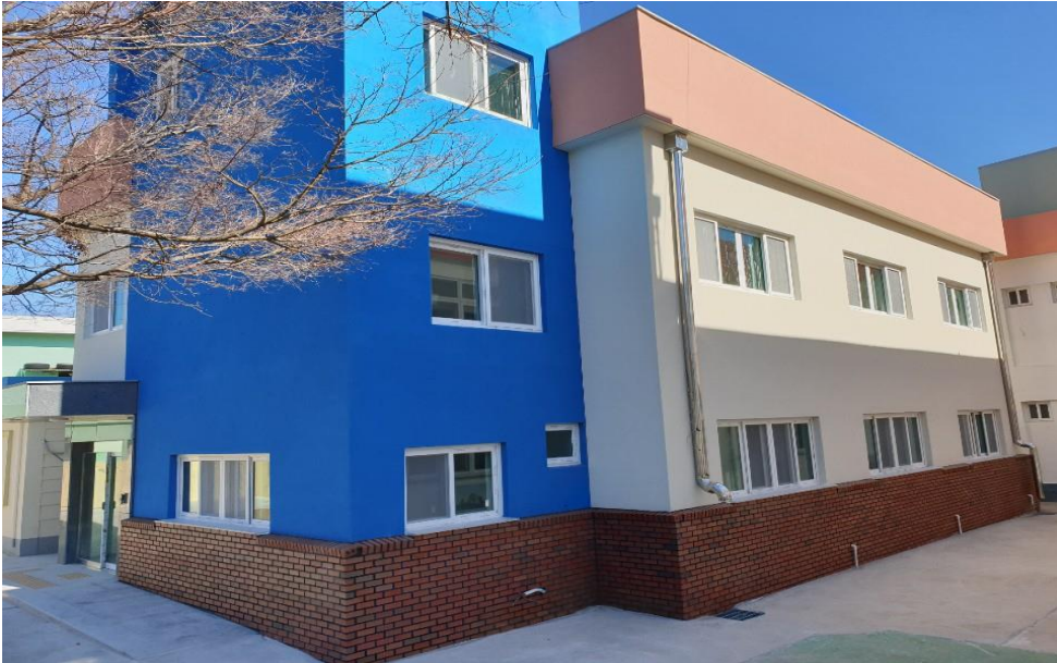
창선고 제2기숙사 증축공사