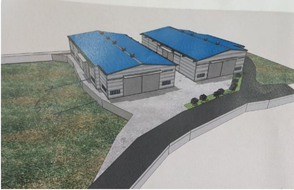
독산리 대진목재 창고 신축공사(진행중)